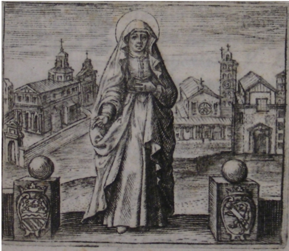
fig. 2. - Santa Lucina Savella, antiporta dell'opera Le Glorie di Santa Lucina, matrona romana , Roma, Cavalli, 1627.