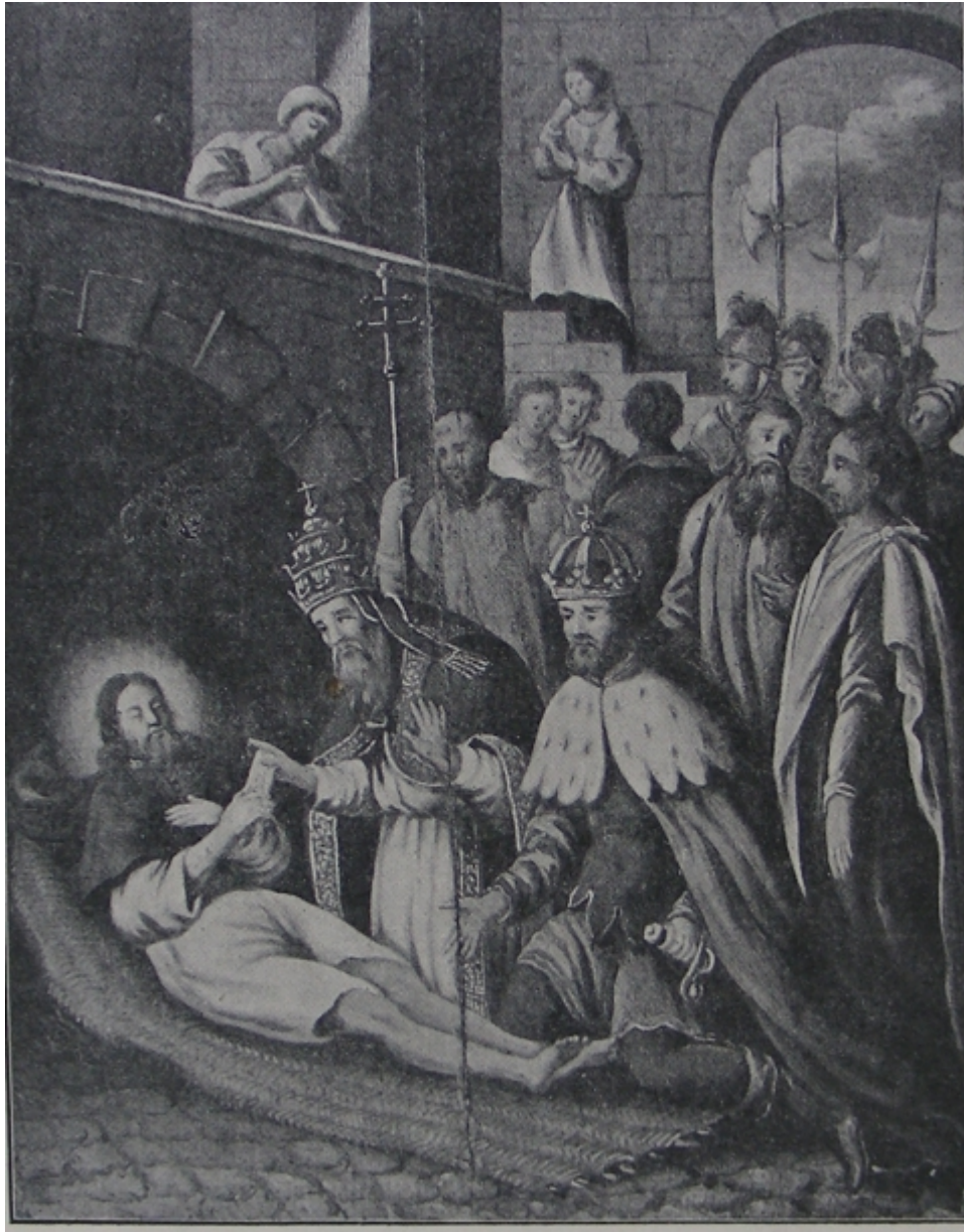
Fig. 14. - Anonimo, Ritrovamento del corpo di sant' Alessio , XVIII sec. Ubicazione ignota.

44 Di tutt'altro segno è la raffigurazione che della scena viene data da Georges de La Tour nel quadro conservato presso il Musée Lorrain de Nancy (1649) dipinto certamente sull'eco delle rappresentazioni teatrali italiane e francesi 74 . Alessio, disteso e con la bocca semiaperta, ha in mano la lettera che contiene la rivelazione. Il suo viso viene investito dalla luce intima e soffusa della torcia del giovane servo, creando tutt'attorno un'atmosfera di religioso silenzio. La Tour estrapola dalla scena una suggestiva inquadratura, rinunciando a ogni superfetazione teatrale. Nella stampa che Claude Mellan dedica nello stesso anno al Ritrovamento del corpo di Alessio , a sua volta correlabile all'incisione di Jacques Callot tratta da Les images de tous le saints et saintes [...] , (Paris, Henriot, 1636), il Confessore romano è raffigurato disteso accanto alla scala alla quale sono appoggiati il cappello a larghe falde e il bordone da pellegrino. Sul petto è posata una croce, segno di una buona morte ; in mano la lettera e, sullo sfondo tragico, un ragazzo fa capolino dalla porta superiore, mentre due astanti, forse i servi schernitori, sono ritratti in atteggiamento sorpreso davanti