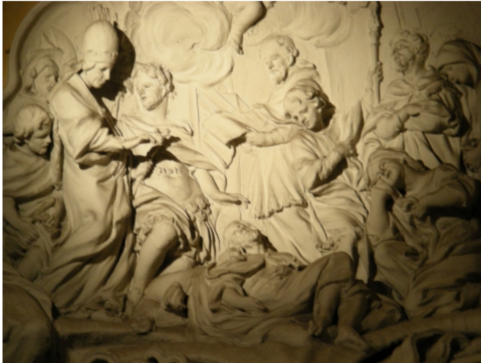
Fig. 8 - Anonimo, Riconoscimento e benedizione del corpo di S. Alessio , 1674 ca. Stucco, Roma, Basilica di S. Alessio, Cappella della Vergine edessena.

Pitture immaginate : un'ékphrasis per la leggenda di Sant' Alessio