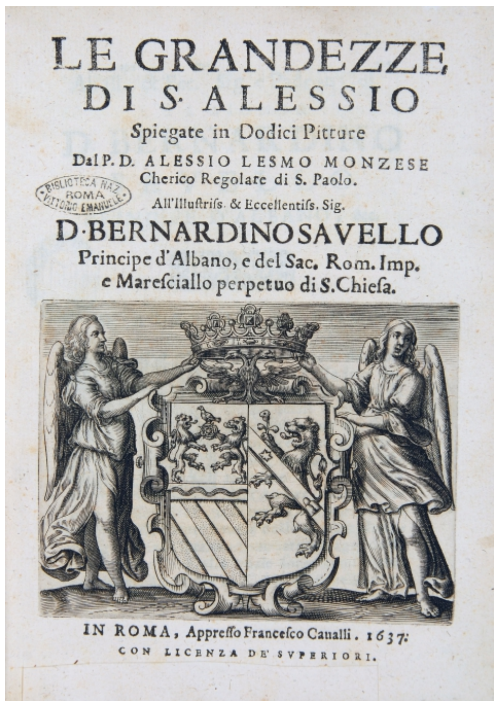
fig. 1 - Frontespizio de Le grandezze di S. Alessio. Spiegate in dodici pitture di Alessio Lesmi (Roma, Francesco Cavalli, 1637).