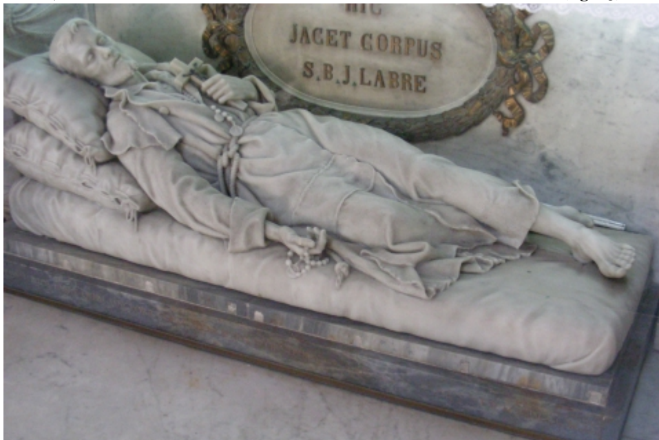
Giuseppe Benedetto Labre, 1891. Roma, chiesa di S. Maria ai Monti.