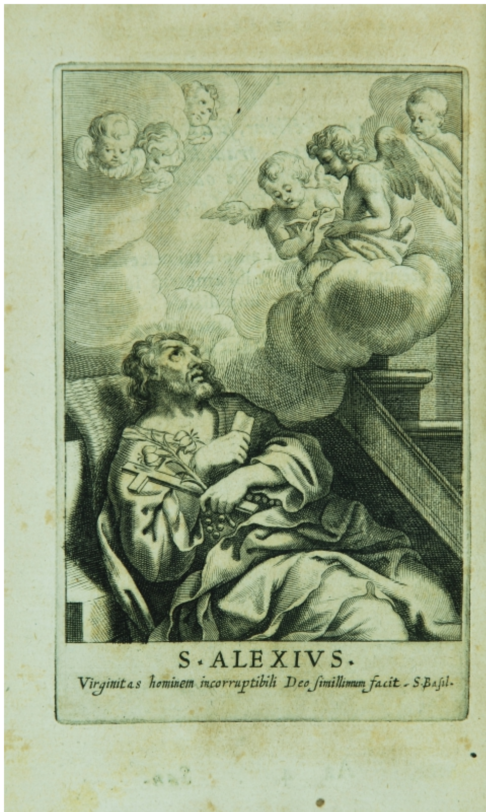
Fig. 11 - Morte di sant' Alessio (da Pietro da Cortona), 1653 ca. Incisione tratta da Clypeus castitatis ex armamentario virginitatis promptus di Giovanni Battista de Rossi (Roma, Manelphj, 1653).

alla biografia di Alessio si accompagna un'illustrazione incisa derivata dal fortunato modello di Pietro da Cortona 60 .