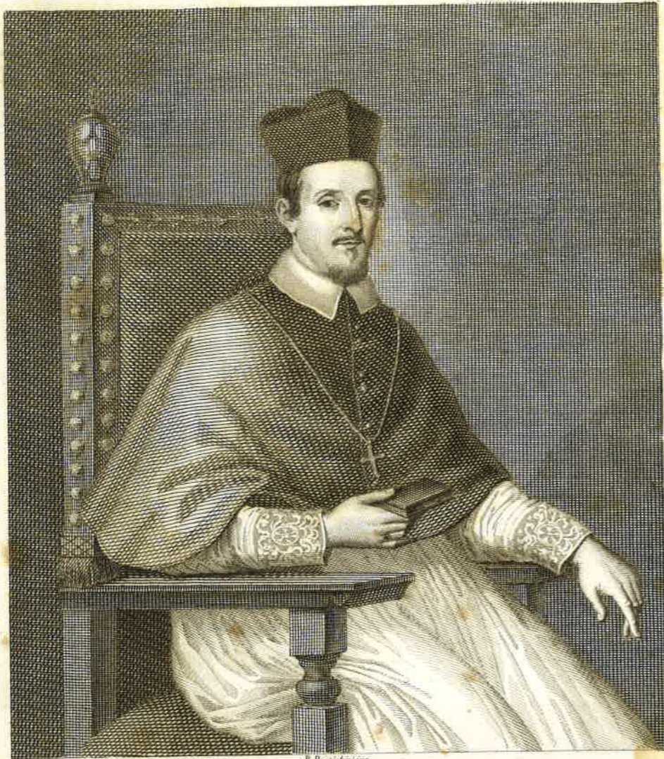
STEFANO COSMI VENEZIANO della Congregazione di Somasca Arcivescovo di Spalatro, e Primate della Dalmazia e di tutta la Croazia chiaro per dottrina e imprese Apostoliche