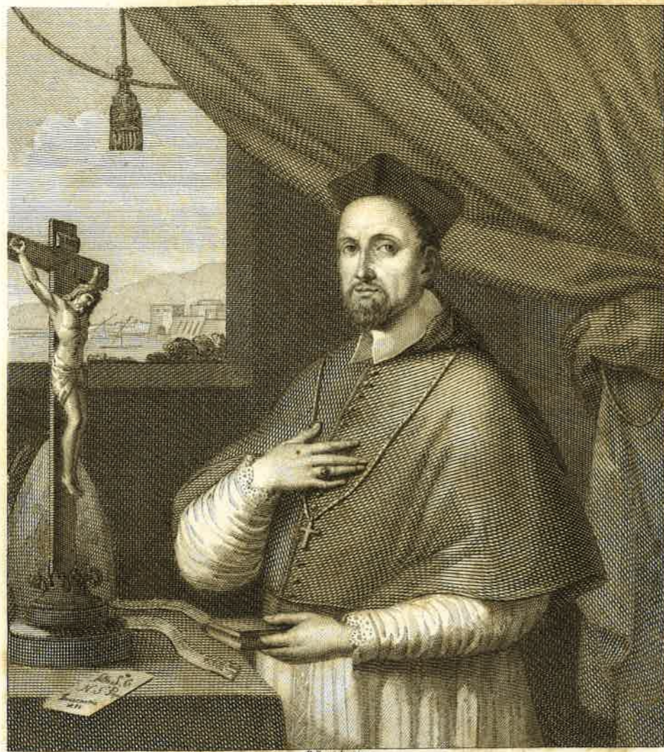
STEFANO CUPILLI VENEZIANO della Congregazione di Somasca Arcivescovo di Spalatro, e Primate della Dalmazia e di tutta la Croazia Da Innocenzo XII. chiamato un altro Francesco di Sales.