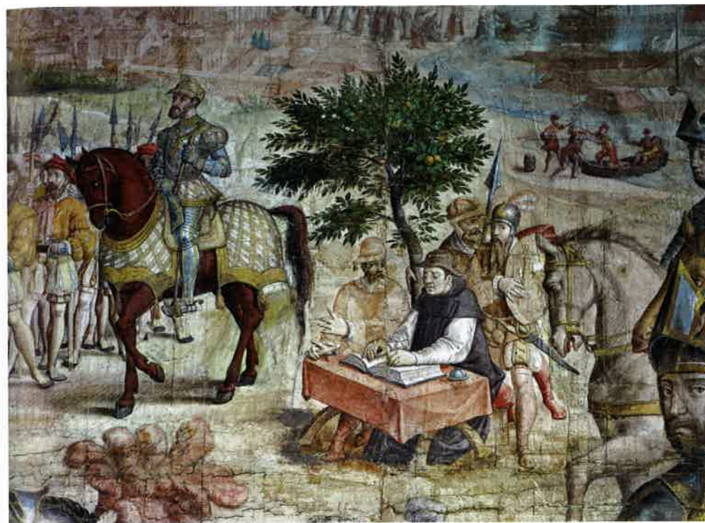
20. Carlo passa in rassegna l'esercito a Barcellona prima di imbarcarsi per Tunisi (1535). A Jan Cornelisz Vermeyen, che accompagnò Carlo nella campagna di Tunisi, vennero commissionati 12 arazzi commemorativi. Il secondo raffigura Carlo a cavallo e in armatura, con il bastone di comandante dell'esercito imperiale e un copricapo che sembra la versione primitiva di un berretto da baseball. Accanto a lui gli scribi registrano ogni dettaglio di un'adunata generale dell'esercito a Barcellona. L'immagine dell'imperatore ricorda più un esperto di logistica che non un guerriero e il monastero di Montserrat che si vede sullo sfondo (e nel quale Carlo era andato a pregare prima di partire per la campagna) rimanda alla natura religiosa dell'impresa.