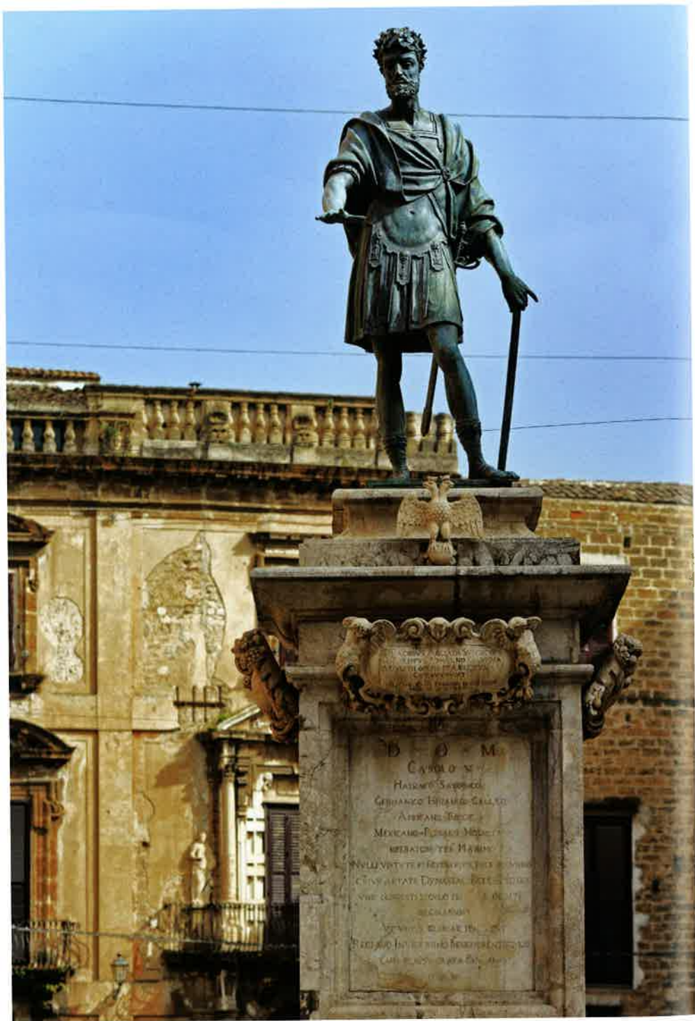
21. Statua di Carlo a Piazza Bologni, Palermo (1535/1630) . L'imponente statua in bronzo a opera di Scipione Li Volsi, eretta nel 1630, raffigura l'imperatore in abiti romani con corona d'alloro in capo. Nella mano sinistra ha il bastone del comando mentre con la destra giura di confermare le leggi e i privilegi concessi al regno di Sicilia un secolo prima.