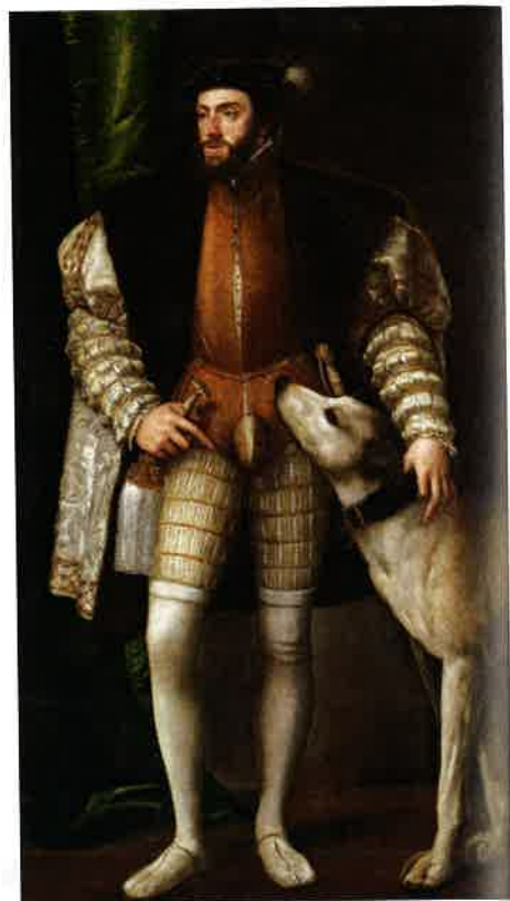
19. Jakob Seisenegger e Tiziano. Ritratti di Carlo (1532-1533). Durante la lunga permanenza a Mantova e Bologna, nell'inverno del 1532-1533, sembra che Carlo abbia posato per due celebri artisti: Tiziano, il pittore preferito del duca di Mantova, e Jakob Seisenegger, pittore di corte del fratello Ferdinando. Il cane che compare in entrambi i dipinti viene descritto dal secondo come « ain grosser englisher Wasserhundt » («un grosso retriever inglese»).