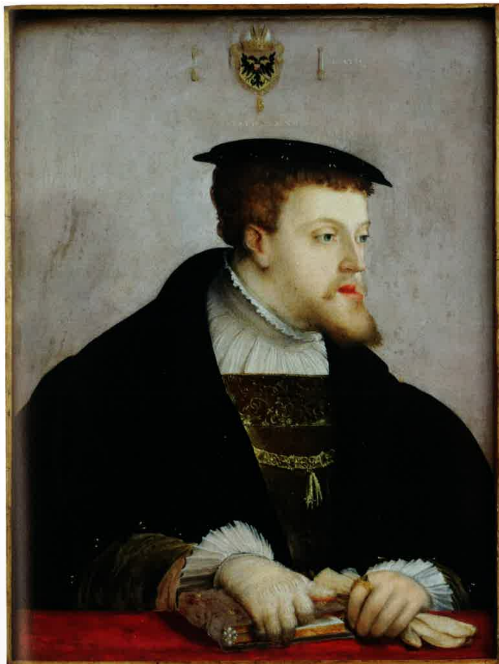
18. Christoph Amberger. Carlo con libro e guanti (1532). Il ritratto raffigura Carlo – inusualmente con un libro – con quei «capelli dorati tagliati corti» che molte testimonianze riportano, e con una barba bionda che a malapena gli maschera la mandibola prominente. La mano che tiene il segno con l'indice è guantata, come se Carlo fosse in procinto di posare il libro e partire per la caccia.