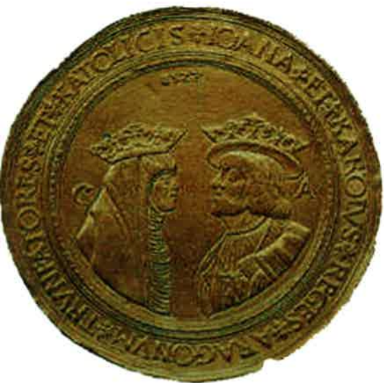
16. Giovanna e Carlo, sovrani d'Aragona (1528). Questa moneta d'oro da cento scudi è probabilmente la prima raffigurazione di Carlo con la barba, anche se l'acconciatura è ancora alla borgognona. Giovanna è abbigliata come una monaca ma ha sul capo la corona reale a ricordare il suo titolo di sovrana d'Aragona e di Castiglia insieme al figlio.