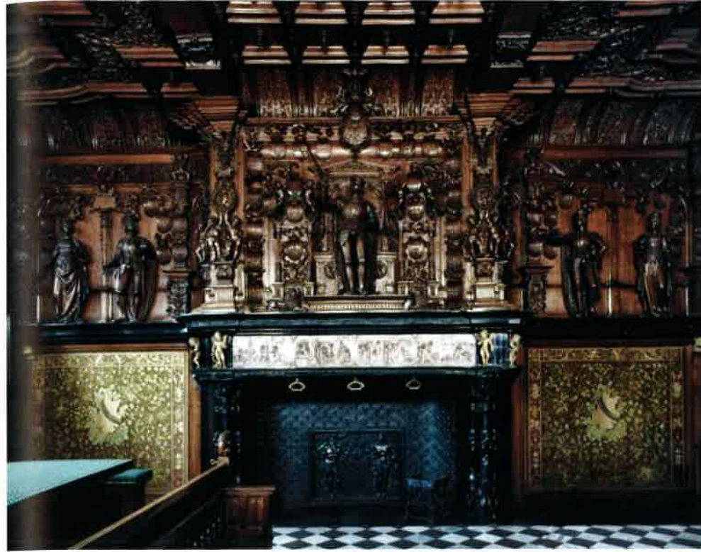
15. Carlo V e i nomi a Bruges (1531). Nel 1528 il Brugse Vrije (una delle castellanie della contea delle Fiandre) commissionò a Lanceloot Blondeel il progetto di un monumento in onore di Carlo per il palazzo di giustizia di Bruges. Ci vollero tre anni per realizzare lo splendido camino in quercia, marmo e alabastro, la cui mensola è ornata dalle statue a grandezza naturale di Carlo, al centro, Maria e Massimiliano a destra, e Ferdinando e Isabella a sinistra. Tutti i maschi ostentano imponenti brachette, senza dubbio per ricordare che le quattro eredità erano state unificate tramite matrimonio e non attraverso azioni di guerra.