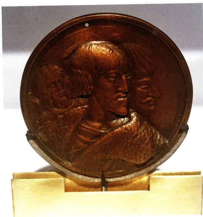
17. L'imperatore Carlo eclissa il sultano Solimano (1532). Carlo, sorretto da un angelo, domina il sultano in questa straordinaria medaglia di bronzo, conosciuta quasi certamente per commemorare la vittoria in Ungheria nel 1532. L'iscrizione recita: «Tu sei destinato, o fortunato Cesare, ad avanzare plus ultra / la spada imperiale farà cadere la testa che si oppone».