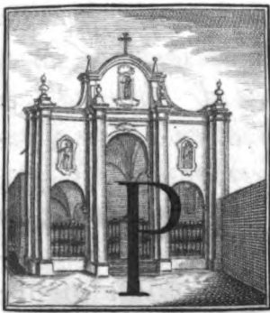
Chiesa di S. Espirito di Piacenza.

Er reprimere la baldanza del famoso Corsaro Dragut, che, dopo aver tolta a' Cavalieri di Malta la Città di Tripoli in Barberia, si era impadronito anche dell' importante Isola delle Gerbe, il Cattolico Re Filippo II. mosso dalle preghiere del Gran Mastro, e più forse dal proprio interesse, raudò una potente Flotta; la quale però trattenuta da' venti contrarj, solamente nel Febbrajo dell' Anno 1560. potè far vela verso le Gerbe, alla cui conquista era destinata. Non mi fermerò io a parlare di questa spedizione, che sfortunatissima riuscì o per l'imperizia de' Capitani, o per la contrarietà della stagione, o per la mala qualità di quel paese. S' impadronirono per verità i Cristiani dell' Isola; ma cotanto andarono temporeggiando in quella conquista, che in soccorso de' Mori pervenne una poderosa armata Turchesca comandata da Piali Balsa, al cui arrivo atter-