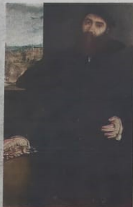
MERCURIO BUA. OPERA DI LOTTO

ti erano un reparto di perlustrazione e, all'occorrenza, di inseguimento del nemico in fuga. Scrupoli non ne avevano. Se catturavano un nemico, gli tagliavano la testa e la portavano al comandante per avere un ducato.