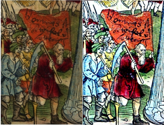
Figura 2 - Saturno con la bandiera rossa.

L'opuscolo, che è ora a disposizione grazie a Google Books, mostra Saturno che porta la bandiera rossa. Sembra evidente che i colori siano stati aggiunti molto più recentemente, come anche la scritta che campeggia sulla bandiera stessa. O forse era così e i contadini portavano proprio una bandiera rossa.