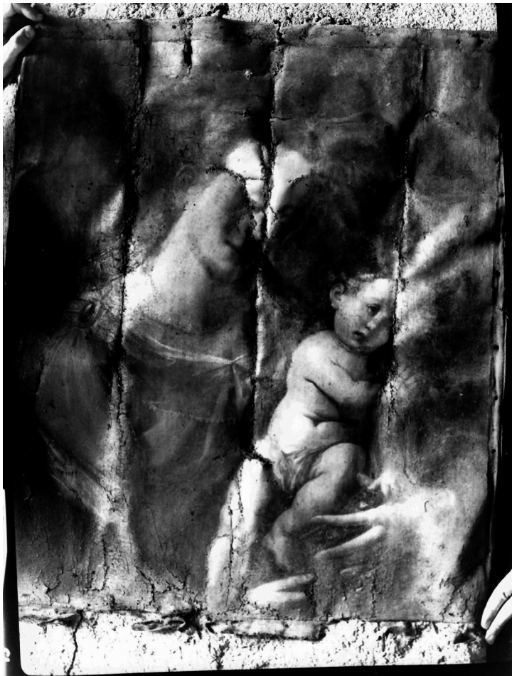
6. Luigi Reali, Madonna con Bambino , foto d'archivio.

dei due artisti a un ideale di semplicità e di chiarezza comunicativa, quasi didascalica, traspare anche dai raffronti che si possono istituire tra alcune opere di soggetto sacro situate in aree pressoché confinanti e collegate da antichi tracciati montani, come la Valsassina e la Valle San Martino: mentre il fiorentino lavorava a