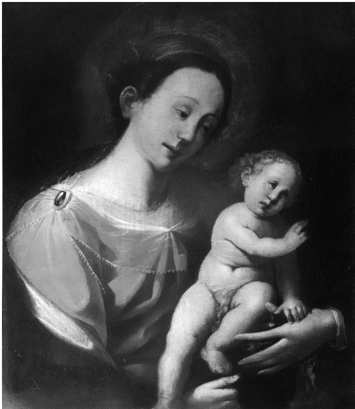
1. Luigi Reali, Madonna con Bambino . Casargo, frazione Narro, chiesa di San Rocco.

essendo entrata in possesso di nuovi dati, torno a riflettere su questo dipinto che può essere a pieno titolo inserito nella pur scarsa produzione ritrattistica dell'artista fiorentino. Innanzitutto vale la pena di rimarcare che l'effigiato apparteneva a un ramo dell'illustre casata dei «Cattaneo Della Torre», insediata sin dal Medioevo in Valsassina 9 dove, tra l'altro, il nostro pittore poté