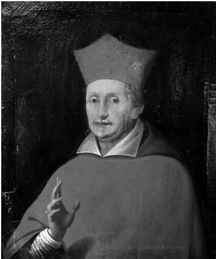
4 Luigi Reali, Ritratto del cardinale Federico Borromeo . Casargo, frazione Indovero, casa parrocchiale di San Martino.

fra gli astanti alle spalle del pontefice proprio la figura del cardinale Federico, che ci restituisce un'immagine fresca e veritiera di quello che doveva essere originariamente il ritratto di Indovero non ancora alterato dalle ridipinture subite. Tale raffronto permette di orientare la datazione del ritratto valsassinese del Borromeo verso la metà del XVII secolo, quando l'artista fiorentino raffigurò anche Giobbe Marazzi, probabile committente dell'effigie di Federico.