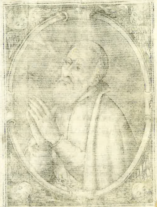
HIERONYMVS, AMILIANVS PATRIVS VERTVVS