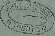
N. 49 - Philostratus, Flavius De vita Apollonii Tyanei. - (1504). - Front.