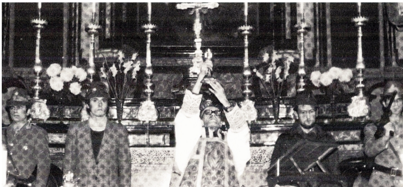
Padre Pigato celebra una Messa con gli alpini sull'altare

Mezzo secolo dalla morte del preside del Gallio