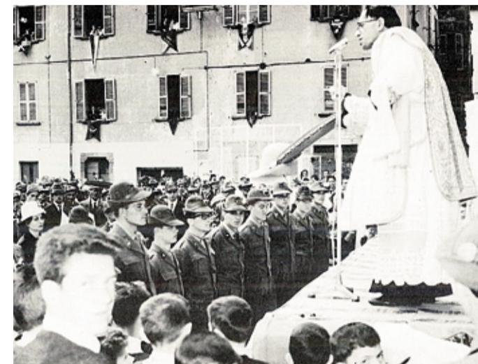
Un'altra immagine di padre Pigato con gli alpini ARCHIVIO

P adre Pigato è sul letto di morte. Sa benissimo che gli mancano pochi giorni di vita, con le ultime forze scrive il suo testamento di poeta e di sacerdote.