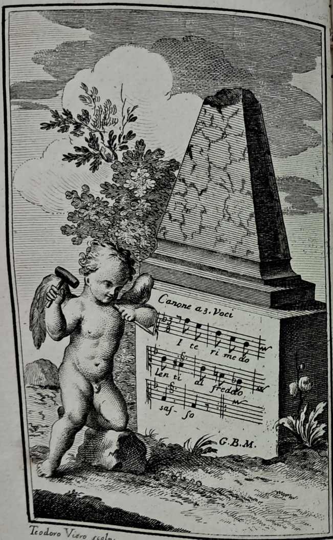
Teodoro Viero sculp.